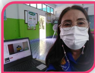
ครูกุหลาบสี จำปี